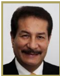
Sen. Rubén Fernando Velázquez López

De los Senadores Rubén Fernando Velázquez López, Graco Ramírez Garrido Abreu, Jesús Garibay García, Fernando Jorge Castro Trenti, Ricardo Monreal Ávila, Pablo Gómez Álvarez, Dante Delgado, Francisco Alcibíades García Lizardi, Adolfo Toldo Infanzón, Luis Walton Aburto, Eugenio Guadalupe Govea Arcos y demás senadores integrantes de la LXI Legislatura del Honorable Congreso de la Unión, la que contiene punto de acuerdo para interponer demanda de controversia constitucional ante la Suprema Corte de Justicia de la Nación contra las disposiciones relacionadas con distribución y comercialización de petrolíferos, publicadas el 30 de marzo de 2011 en el Diario Oficial de la Federación y su primer acto de ejecución que se hace consistir en la emisión del instrumento contractual a que se refieren los artículos 3 y 4 de dichas disposiciones.