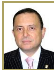
Sen. Fernando Jorge Castro Trenti