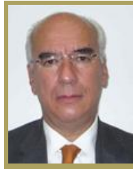
Sen. Dante Delgado