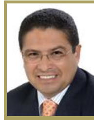
Sen. Adolfo Toledo Infanzón