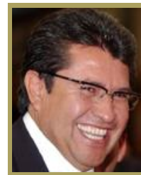
Sen. Ricardo Monreal Ávila