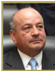
Sen. Jesús Garibay García