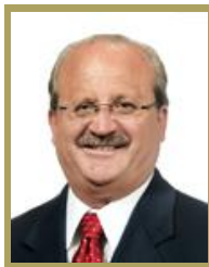
Sen. Graco Ramírez Garrido Abreu