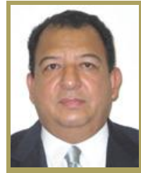
Sen. Luis Walton Aburto