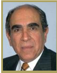
Sen. Pablo Gómez Álvarez