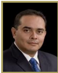
Sen. Eugenio Guadalupe Govea Arcos